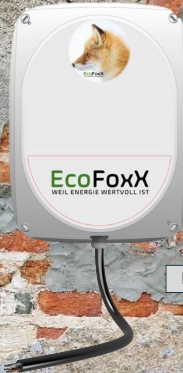
EcoFoxX LA 400.16